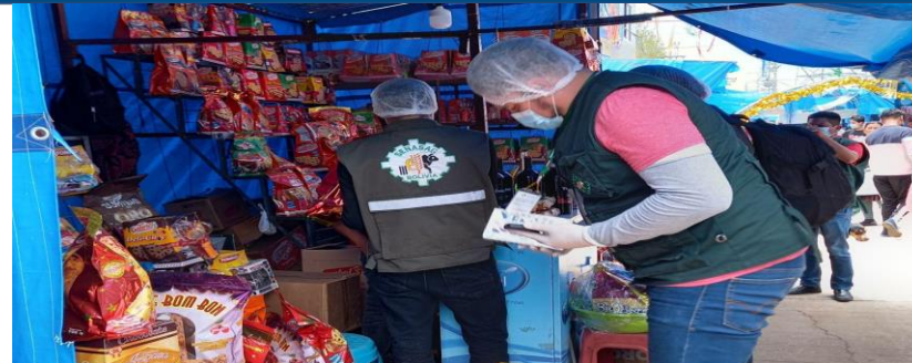
FOTO 2: Control a feria navideña en coordinación con SENASAG, para verificar la legalidad de los panetones.