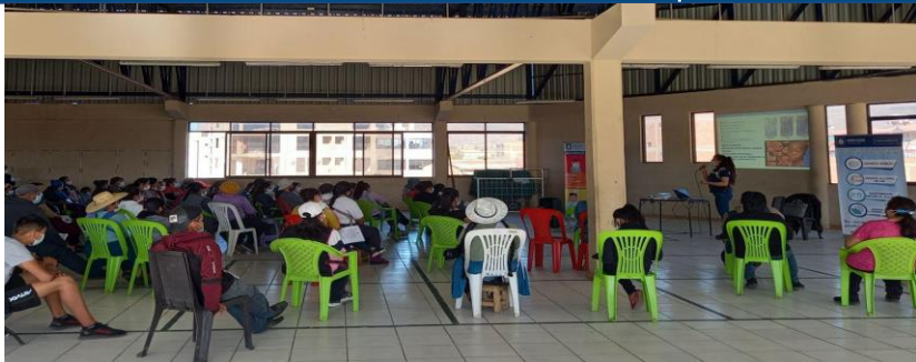
FOTO 1: Taller de capacitación en inocuidad alimentaria a comerciantes del mercado de abasto.