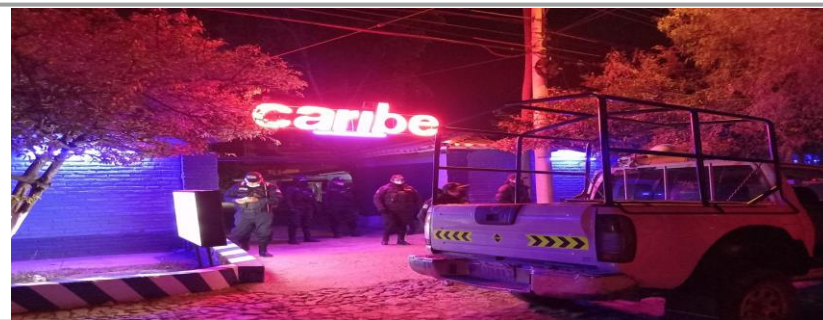
FOTO 4: Operativo nocturno a moteles para verificar el cumplimiento de protocolos de bioseguridad.