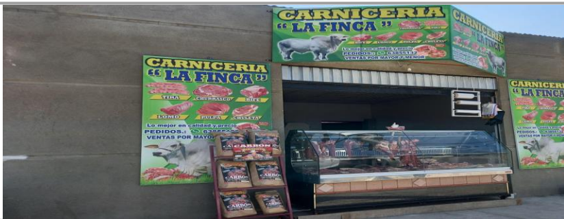
FOTO 3: Inspección a carnicería para el cumplimiento de buenas prácticas de higiene.