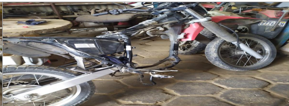
FOTOS: Mantenimiento de motocicletas