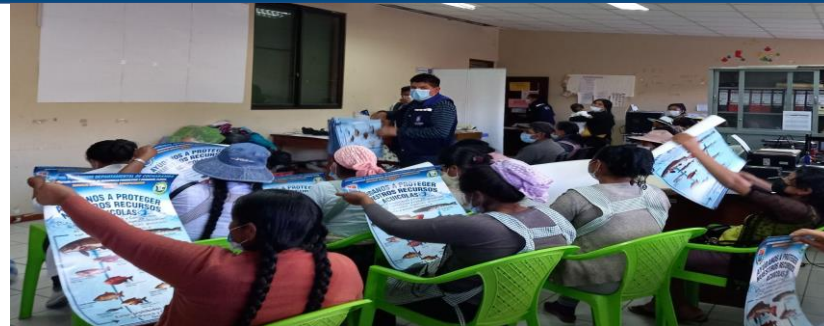
FOTO 2: Entrega de afiches de normas de comercialización de especies piscícolas a comerciantes.