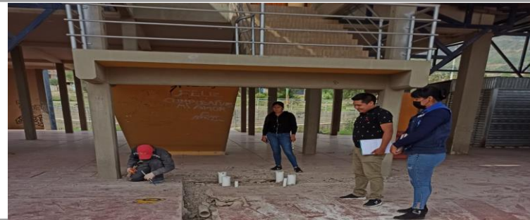
FOTO 4: Verificación para el mantenimiento del mercado san francisco de asís.