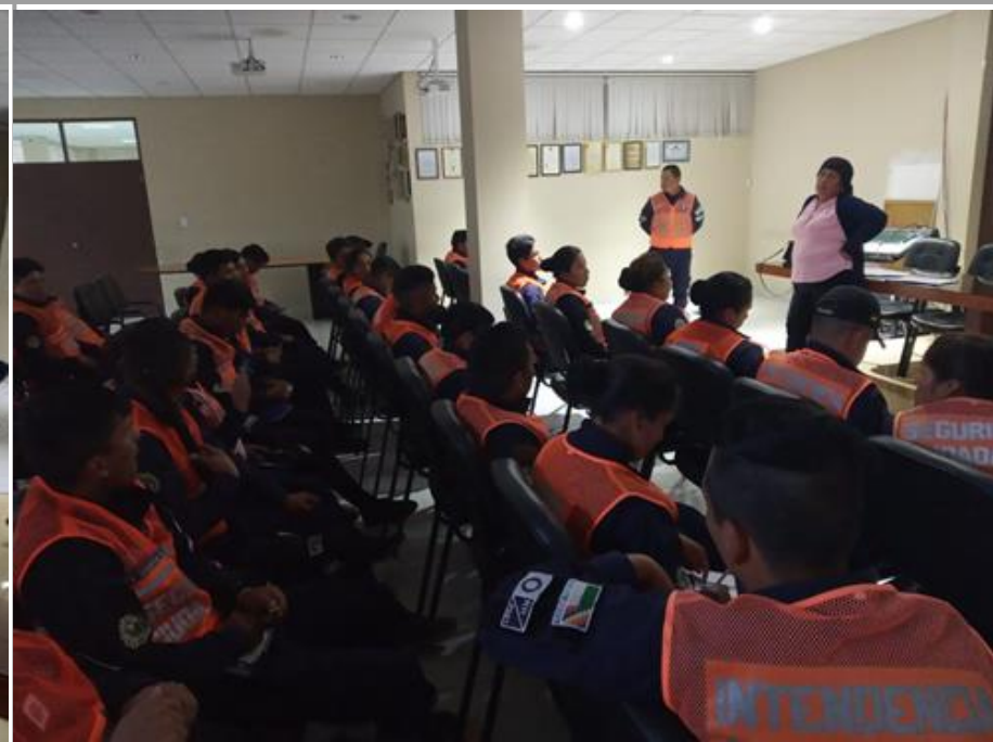
FOTOS: Capacitaciones en seguridad ciudadana y educación vial