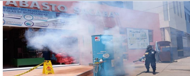
FOTO 2: Desinfección del mercado de abasto con Thermonebulizador predios del mercado de abasto.