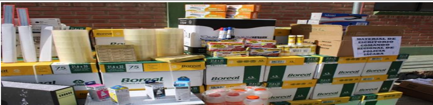
FOTO 7: Equipamiento de material de escritorio para el Comando Regional Sacaba