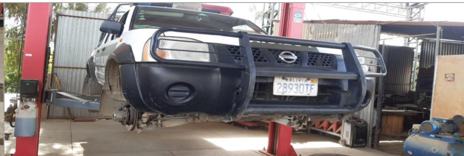
FOTOS: Mantenimiento de camionetas